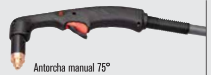
Antorcha manual 75°

(visitar www.hypertherm.com para más opciones de antorchas)